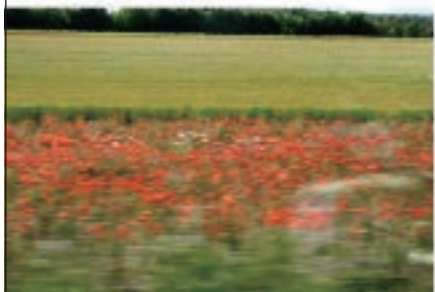
6月はまだ花々が美しい季節～何の花でしょう？

性に近づき、首からぶら下げた箱にコインを入れてもらったのだ。なるほど、これは彼の日課なのかもしれない。列に並んでいる人もコインを入れてあげていて、そこら辺が日本とちよつと違うかも。 イギリスの道路の交差点は日本と違って、直角に交差しておらず、ロータリーみたいになっていて右回りに走りながら1つ目の文岐路へ入ると左折、2つ目が直進、3つ目が右折ってという具合になっている。目的方向へ入れなかつたらそのまま周回して再トライすればいい。異国の見知らぬ道で迷子になると、カーナビをつけてもらっていて、「Turn to the second road」とか言ってくれるから、最初ドギマギしたけれど、1つ目、2つ目と数えて何とか無事にユホッ。都市部の繁華街には普通の交差点もあるけれど、この英国方式は信号もなく、ノンストップで曲がって行けるからものすごく合理的なのではないかしらね？ドライバーのマナーも良かった！ 慣れない道を慣れない車で走るのは疲れるので、1時間程走っては、サービスエリアに寄ったのだけれど、英国滞在中、日本でのスタバ同様にお世話になったCOSTAとM&S（スーパー）が両方ある所に寄るのが定番になった。手軽にサラダやヨーグルトなどのランチや水を買えるから便利。他に子供用の遊技場や展望台もある所など、ちよつとずつ違っていて、なかなか飽きなくて良かった。 さて、予定より2時間遅れの出発となったこの日は、まずはコッツウォルズ地方の村巡り。スタート時点では少々曇っていたけれど、段々晴れてきて良かった！（次号へ）