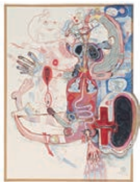
ルボシュ・ブルニー <無題> 2001年 abcd コレクション