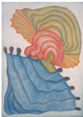
アンナ・ゼマーンコヴァー <深みからの上昇> 1965年 abcd コレクション