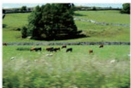
電車の車窓から見えるのは羊が多いけど、車からは牛が～