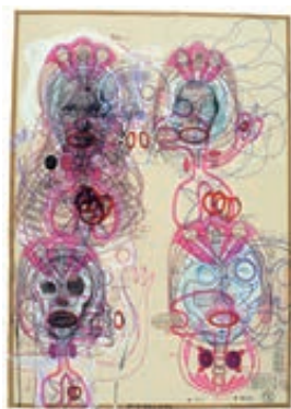
ルボシュ・ブルニー <無題> 2008年 abcd コレクション