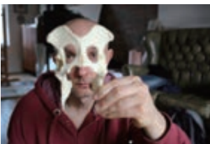
ルボシュ・ブルニー 肖像写真撮影 ©マリオ・デル・クルト