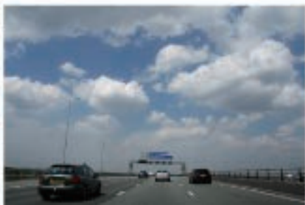
道路の両サイドが防音壁などで覆われてないのが快適♪