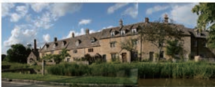
通りすがりの大きな建物も素敵だけれど、1枚の画像に収まらない！笑～