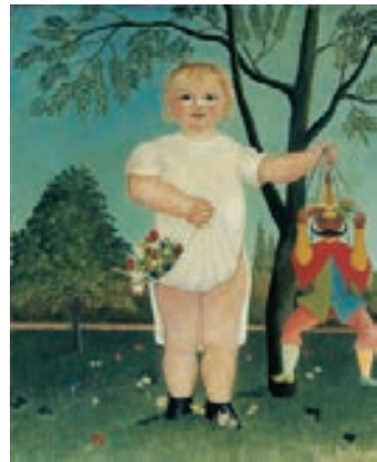
アンリ・ルソー ＜赤ん坊のお祝い！＞1903年