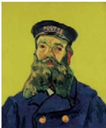
フィンセント・ファン・ゴッホ ＜郵便配達人 ジョセフ・ルーラン＞ 1888年