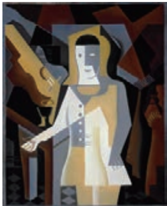
ファン・グリス ＜ピエロ＞1919年