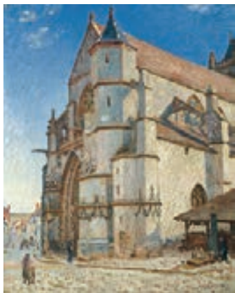
アルフレッド・シスレー ＜朝日を浴びるモレ教会＞1893年